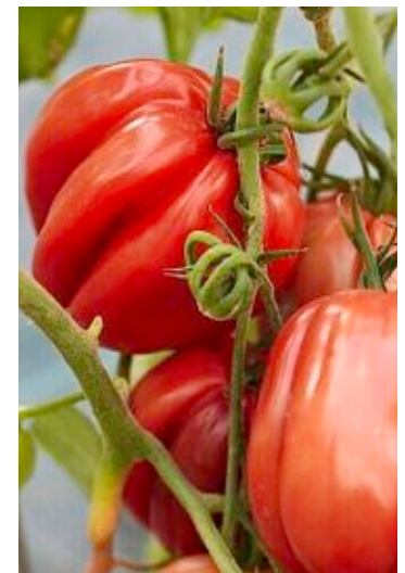
Italienische Leckerbissen: Die Blattzichorie Catalogna Frastagliata (Bild links) und die gerippte Fleischtomate Gezähnte Bühler-Kehl.